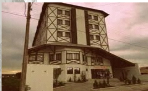
Imagem 02: Hotel Oma Zita