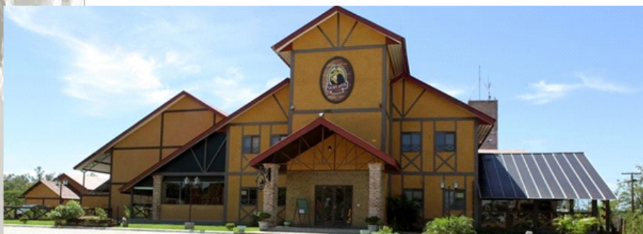
Imagem 01: Cervejaria Saint Bier

Na paisagem urbana da cidade é notória a existência das construções contemporâneas que utilizam a cópia do enxaimel (sistema construtivo alemão), para compor suas fachadas ( ver imagens 01, 02 e 03). Assim, a cidade faz uso de imitações para resgatar o caráter da cultura local, imitações essas que não contribuem para o fortalecimento da memória e da identidade cultural.